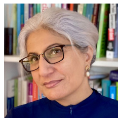
Farwha Nielsen Konsult, utbildare & författare