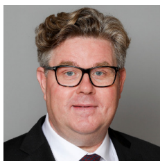
Regeringskansliet Gunnar Strömmer Justitieminister