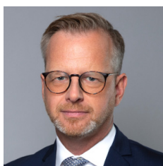
Regeringskansliet Mikael Damberg Inrikesminister